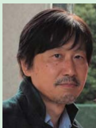
児島 秀樹 (脚本家)