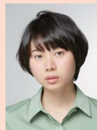
金澤 美穂 (女優)