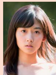
桐島 ココ (女優)