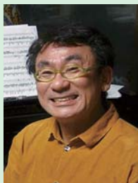
丸山 和範 (作曲家)