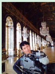
館岡 悟 (撮影監督)