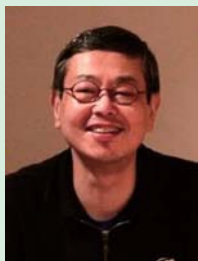
宇井 孝司 (演出家、監督、脚本家、音響監督)