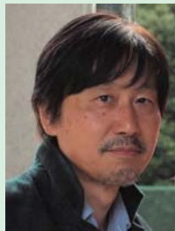
児島 秀樹 (脚本家)