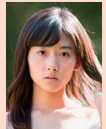
桐島 ココ (女優)