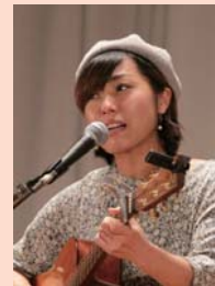
佐々木 詩菜 (シンガーソングライター)