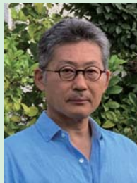
深澤 義啓 (テレビ・映画プロデューサー)