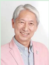
島 敏光 (映画評論家、エッセイスト)