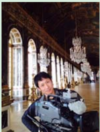
館岡 悟 (撮影監督)